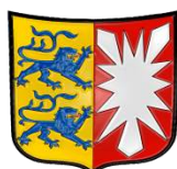
Sachsen Rheinland-Pfalz Schleswig-Holstein